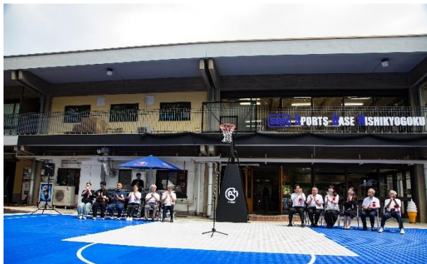
<オープニングセレモニー>