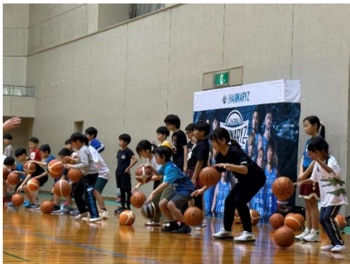
<バスケットボールクリニック>