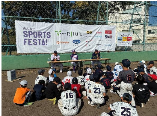
<元プロ野球選手による野球教室>