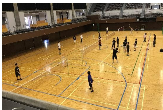
<京都市体育館 バドミントン>