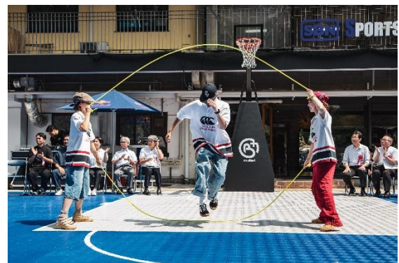
<ダブルダッチパフォーマンス>