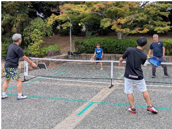
<ピックルボール体験>