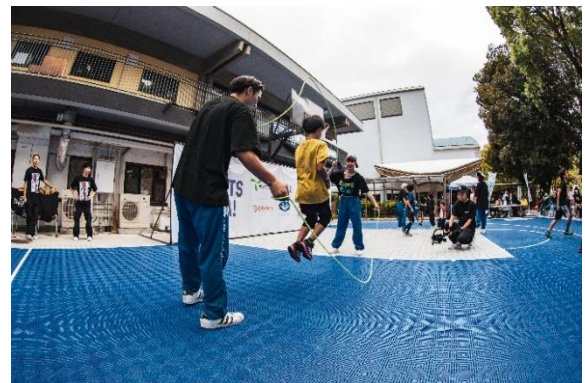
<ダブルダッチ体験>