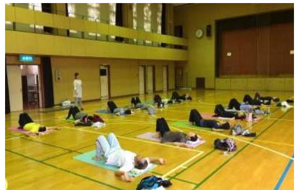
<伏見北部体育館 健康ヨガ教室>