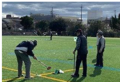
<吉祥院公園 グラウンド・ゴルフ>