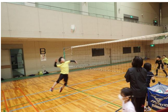
<横大路体育館 バレーボール教室>