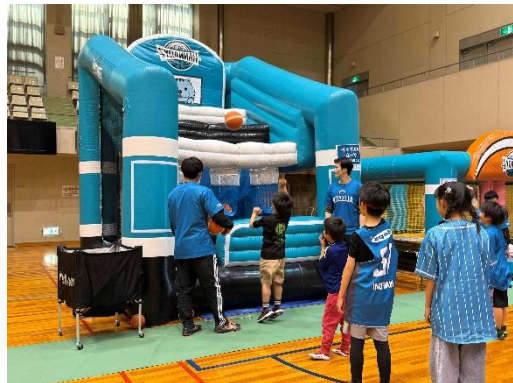
<バスケットボール体験コーナー>