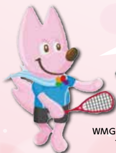
WMG大会マスコット「スフラ」 ~Sport for Life~

WMG2021関西スカッシュ競技の会場として、新たに「京都スカッシュパーク(仮称・2022年4月完成予定)」が決定しました。当施設は、(株)ホリゾン(京都市南区)が建設する複合施設で、関西有数規模のスカッシュコートが備わっています。WMGの成功とスカッシュ競技の発展を支援し、大会終了後のレガシー創出、地域振興にも寄与していくこととなります!