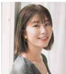
タレント 稲村 亜美