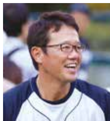
元東京ヤクルトスワローズ選手・監督 スポーツ解説者 キャプテン 古田 敦也