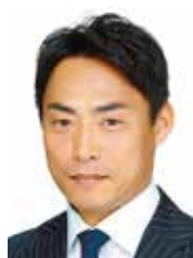
元阪神タイガース選手 スポーツ解説者 検山 進次郎